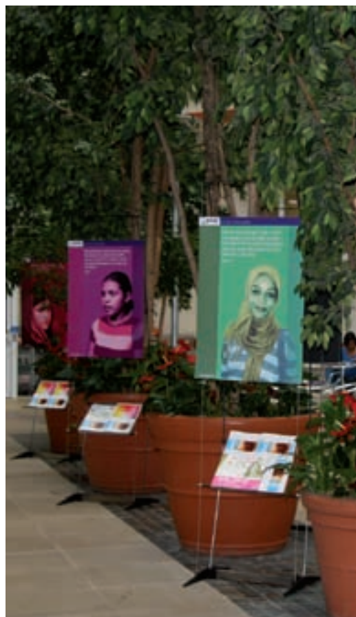
La exhibición fotográfica para el Día Mundial de SIDA en el Department for International Development (DFID) en Londres.

Conferencia Internacional de SIDA Ciudad de México, México