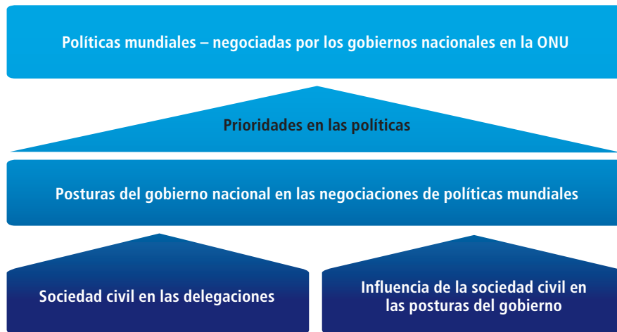
Figura 1: Papel crucial para la sociedad civil